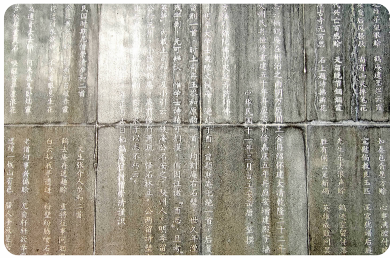
栖鹤庵诗碣文化墙局部。