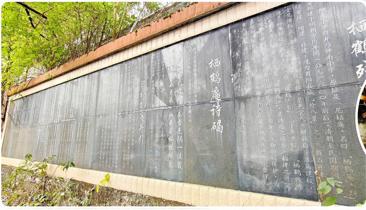
栖鹤庵诗碣文化墙。