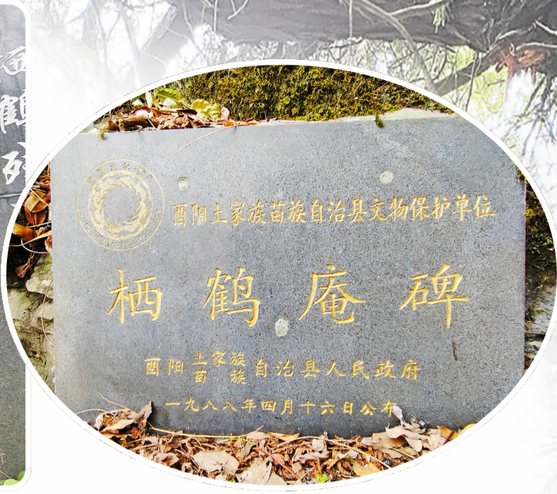
栖鹤庵碑被列入文物保护单位。