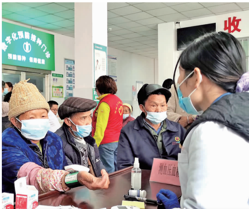
当地群众在义诊现场检查身体。

供查体、健康咨询、把脉问诊等服务,并针对群众健康情况给予合理诊疗意见和用药指导,为群众讲解常见病、多发病的健康知识。同时,当地中心医院医生也免费为群众测量血压、血糖,提醒患高血压高血糖的群众加强检查和用药,注意生活饮食。