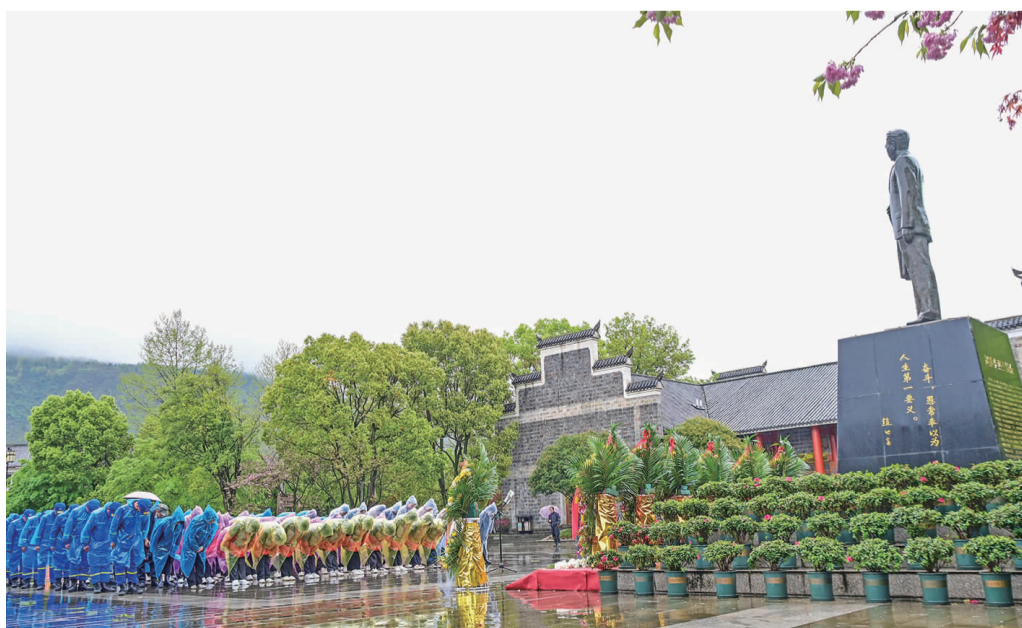
4月4日,我县各地学生和青年志愿者一起来到赵世炎烈士塑像前献花缅怀,寄托哀思。清明节来临之际,我县党员干部、群众、学生纷纷走进烈士陵园、烈士故居开展祭扫活动,缅怀革命先烈,接受红色教育,赓续红色血脉。

赵世炎烈士追思活动结束后,杨通胜、唐应珊、代成瑶等县领导同县有关部门负责人一起前往县烈士陵园瞻仰,并敬献鲜花。