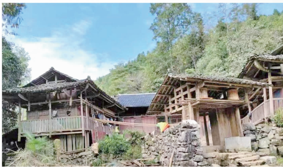
保存完好的吊脚楼。