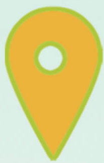
地标:兴隆镇积谷坝村