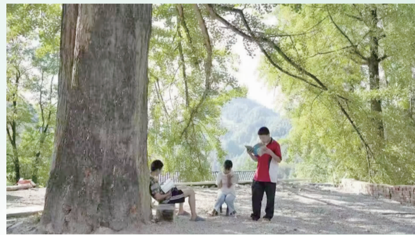
在树下静心阅读的学生。