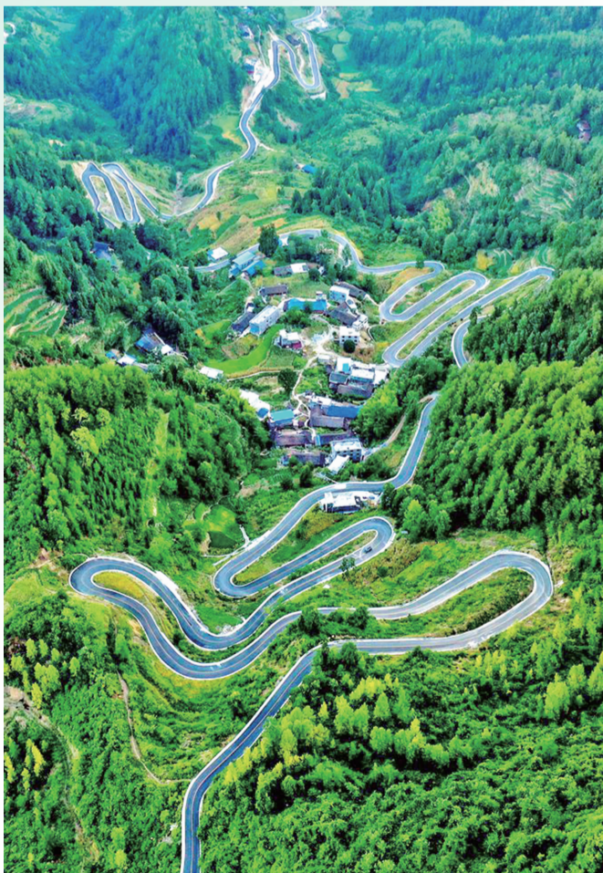
乡村公路美如画。

天地有大美而不言。 多彩的铜鼓也没有言语,从来没有喧天地夸炫,一直任由过客从川盐古道,或者后来的西襄路上或走、或停。偶尔一处耀眼的颜色眩晕了你的眼睛,这不是吆喝,不过是满园沸腾的春色不经意间墙外的人窥了一眼去。这个铜鼓,是有既韧且密的纹理,有既绚烂又古朴的颜色的。