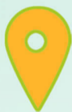
坐标:铜鼓镇铜鼓村