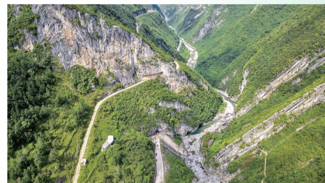
迷人的江东峡风光。资料图片