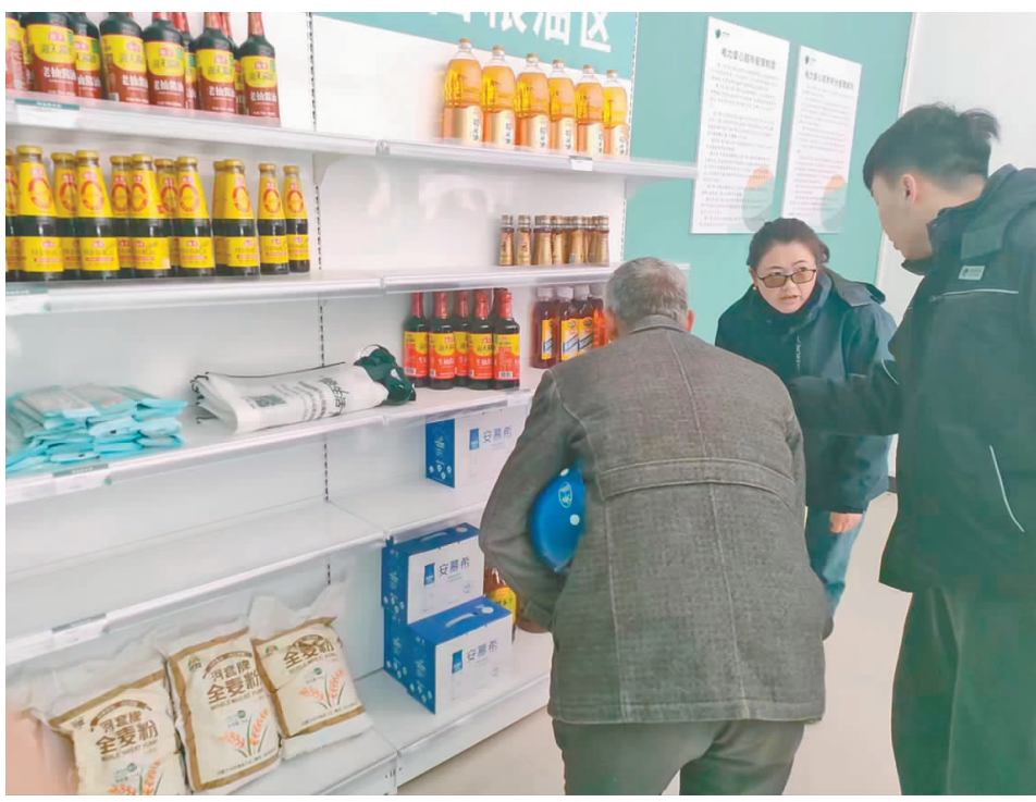
村民正在兑换物品。