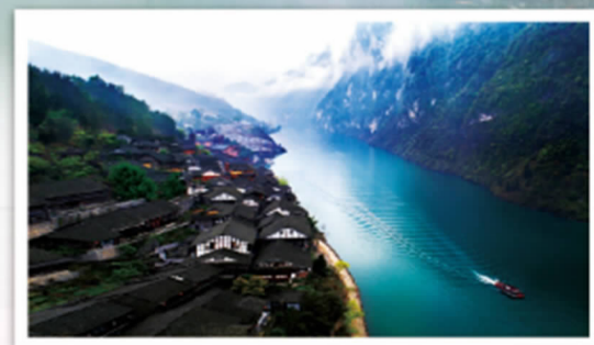
龚滩古镇·乌江画廊

咨询电话: 023-75559222 (桃花源景区) 023-75706888 (龚滩景区) 023-75567999 (叠石花谷景区)