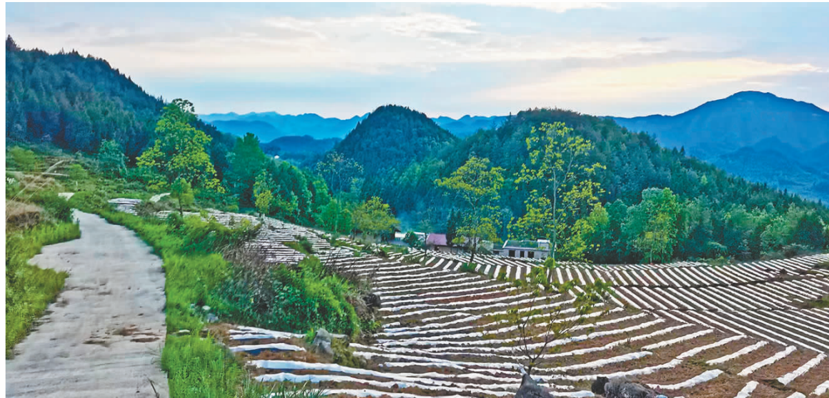
烤烟基地。