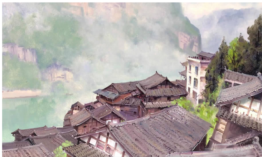
翁凯旋作品《醉美龚滩系列之五》。